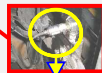
Umístění tenzometrického snímače hydraulického tlaku na vysokozdvížném vozíku