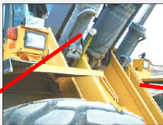
Umístění snímače polohy lopaty a tenzometrického snímače hydraulického tlaku na lopatovém nakladači